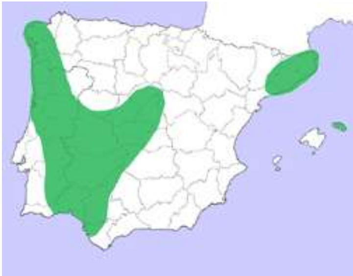
Mapa de distribució de Serapias vomeracea a la Península Ibèrica.

Fins el dia d'avui al nostre terme municipal hem trobat dues espècies d'orquidees: Serapias vomeracea i Ophris apifera , la primera de les quals destaca per ser una espècie escassa a Catalunya i a bona part de la Península Ibèrica.